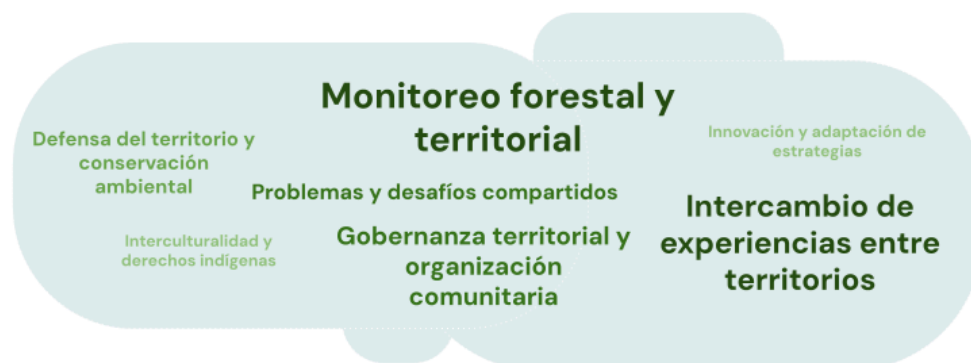
Figura 1. Nube de palabras con los principales aprendizajes identificados por los participantes clasificados por recurrencia

Para evaluar el impacto del intercambio en las capacidades y aprendizajes de los participantes, Bosques del Mundo aplicó una encuesta antes y después del evento (Anexo X). Esta medición nos permite comprobar que los participantes fortalecieron sustancialmente sus conocimientos y capacidades en todos los temas evaluados.